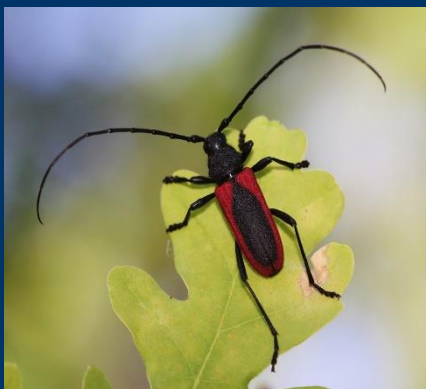
Усач – краснокрыл