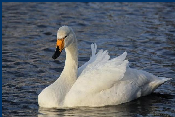
Лебедь - кликун