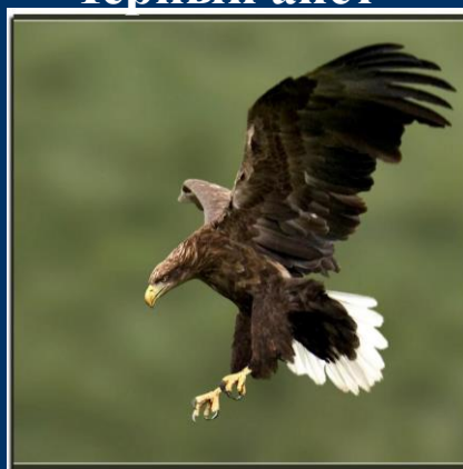
Орлан - белохвост