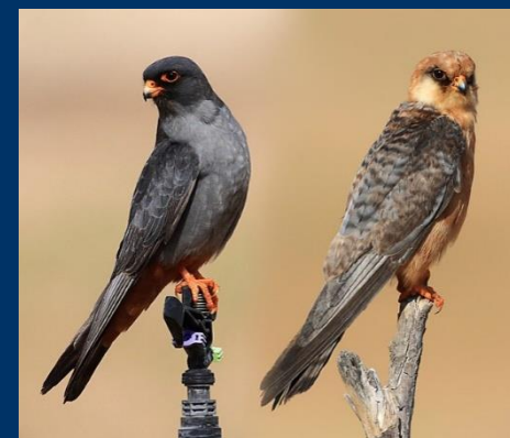
Кобчик (самка и самец)